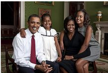
Abbildung 9 - Familie Obama - 2009