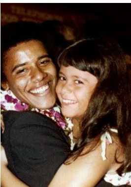
Abbildung 7 - Barack Obama hier mit Halbschwester Maya - 1979