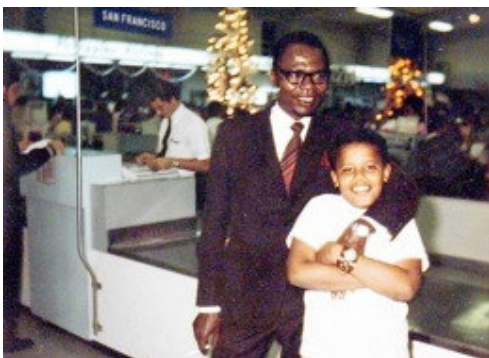
Abbildung 3 - Barack Obama mit seinem Vater (ca. 1972)