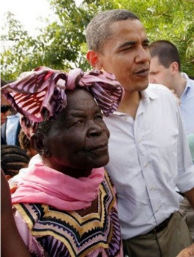
Abbildung 6 - Barack Obama mit seiner Großmutter - 2006