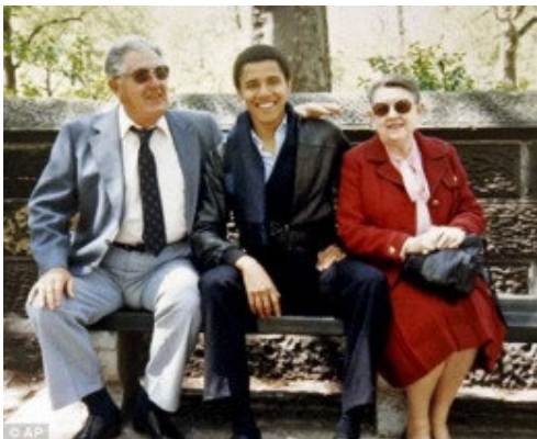
Abbildung 5 - Barack Obama mit seinen Großeltern, ca. 1980