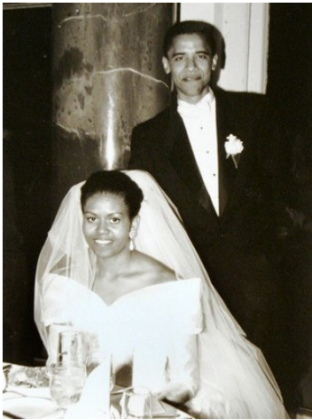
Abbildung 8 - Hochzeitsbild Michelle und Barack Obama - 1992